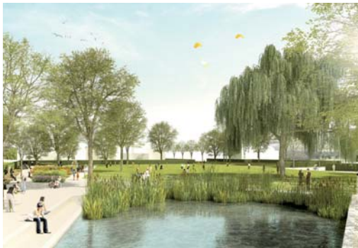
2011 Neugestaltung Ortskern Verl, Verl, 2. Preis