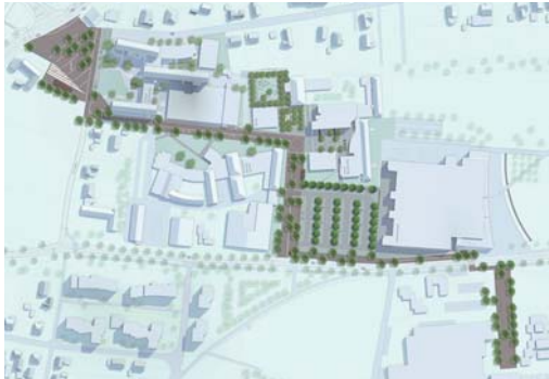
2010 Neugestaltung Bildungs- und Forschungs- meile Lemgo-Lüttfeld Lemgo, Anerkennung