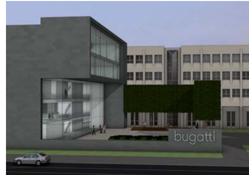
2009 Außenanlagen Hauptverwaltung bugatti, Herford, 2. Preis