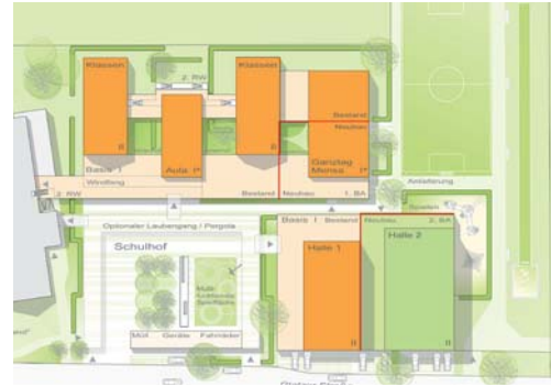
2010 Außenanlagen Grundschule St- Georg, Verl-Sürenheide, 1. Preis