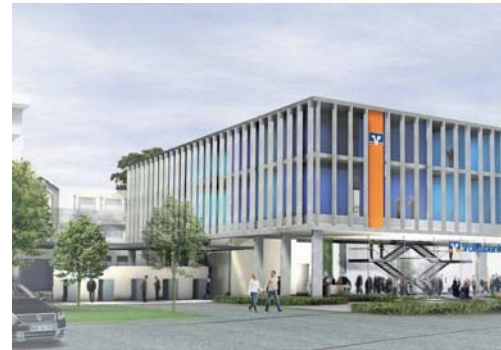
2008 Außenanlagen Hauptverwaltung Volksbank Hamm, Hamm, 2. Preis