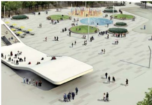
2010 Neugestaltung Kesselbrink, Bielefeld Teilnahme