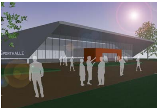
2009 Außenanlagen Sparkassenarena, Versmold, 1. Preis