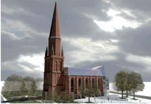
2009 Außenanlagen zum Umbau der Marienkirche zu einem Kammermusiksaal, Bochum, 3. Preis