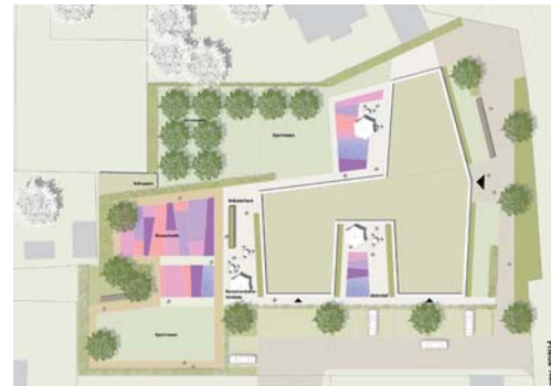
2009 Außenanlagen Wohnheim für Behinderte, Frieda-Nadig-Weg Herford, 2. Preis