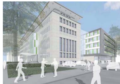
2010 Außenanlagen Neubau Technisches Rathaus, Bielefeld, Ankauf