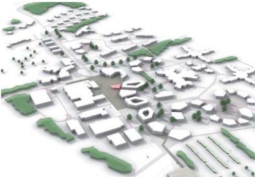
2009 Quartiersentwicklung Eben-Ezer, Lemgo, Teilnahme