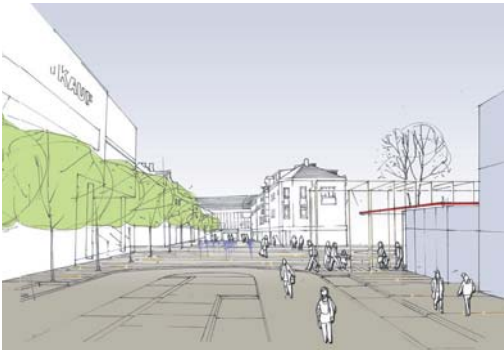
2009 Neugestaltung Stadtmitte Bergisch-Glad- bach, Bergisch-Gladbach, Teilnahme