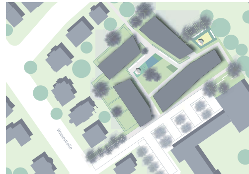
2010 Außenanlagen Neubau „Wohnen am Pöppelmannwall“ Herford, 2. Preis