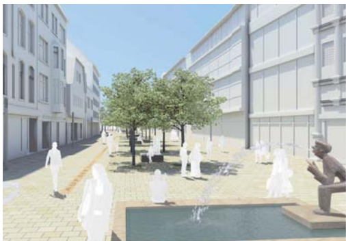
2011 Neugestaltung Fußgängerzone, Minden i.W., 5. Preis