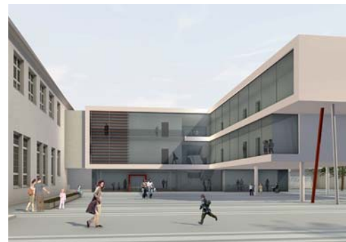
2009 Außenanlagen Gymnasium am Markt, Bünde, 2. Preis